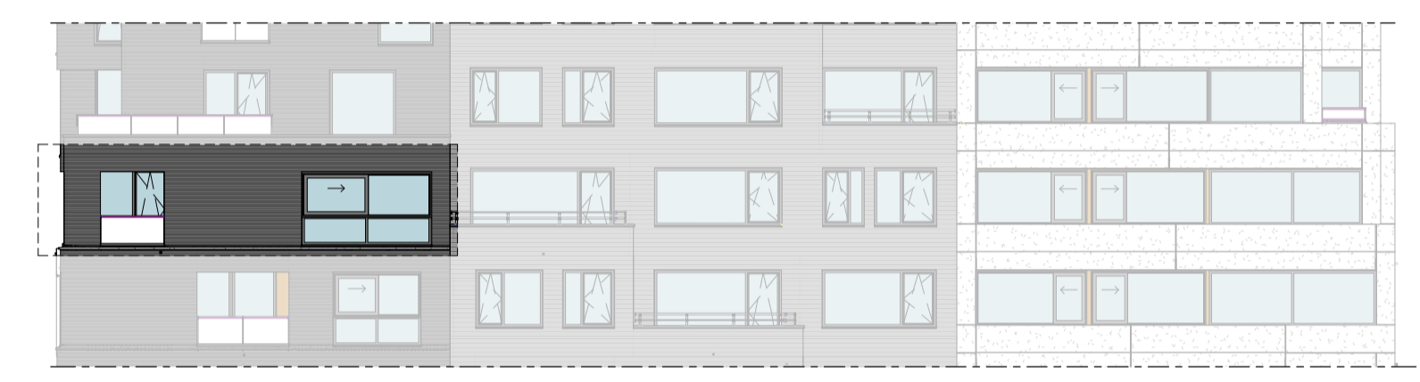
Westgevel 1 : 200