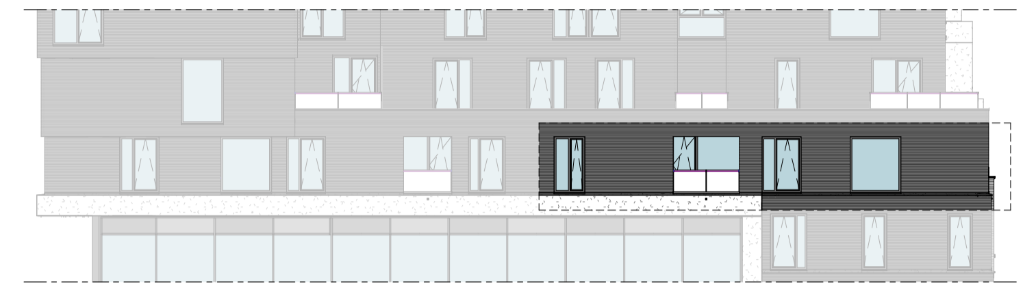
Noordgevel 1 : 200