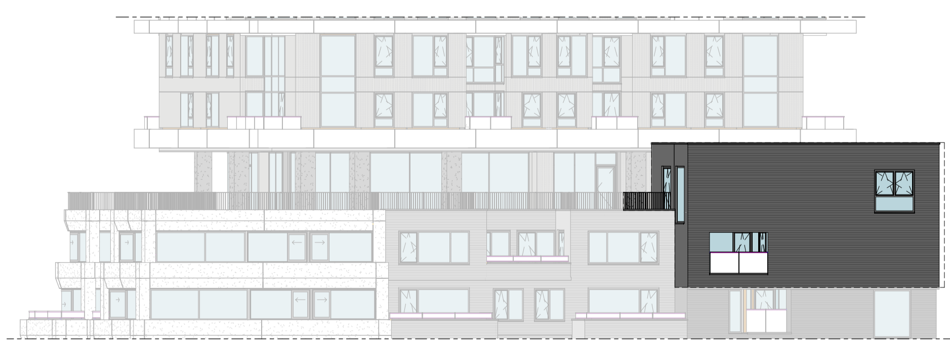
Oostgevel 1 : 200