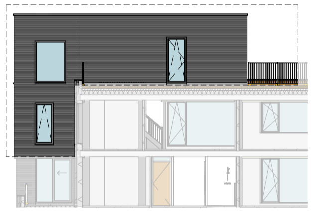
Westgevel 1 : 200