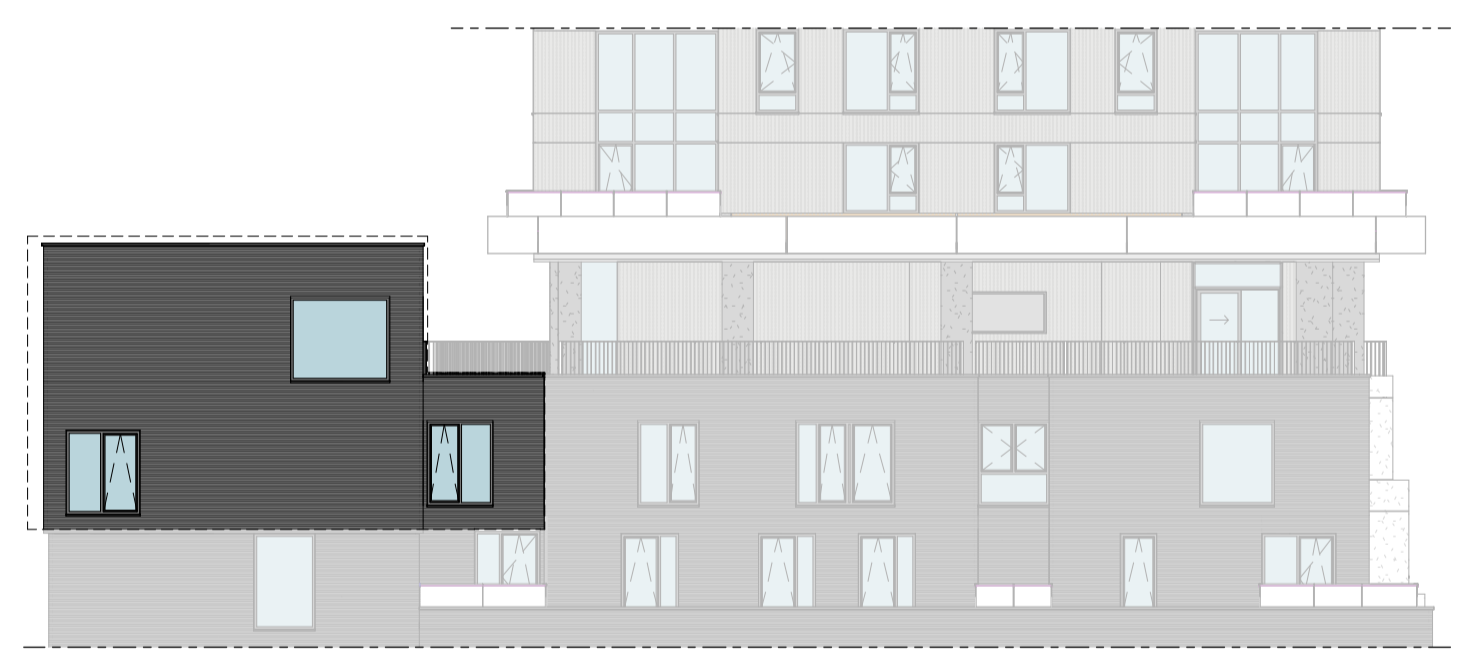
Noordgevel 1 : 200