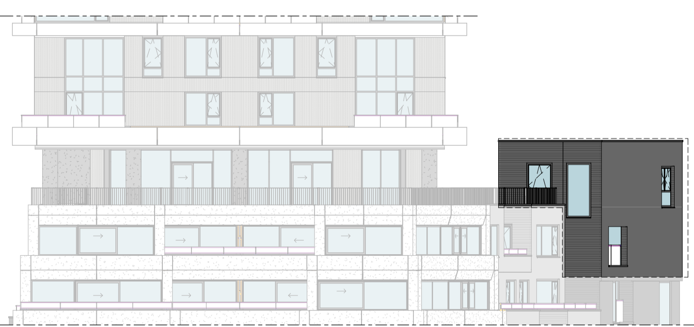
Zuidgevel 1 : 200