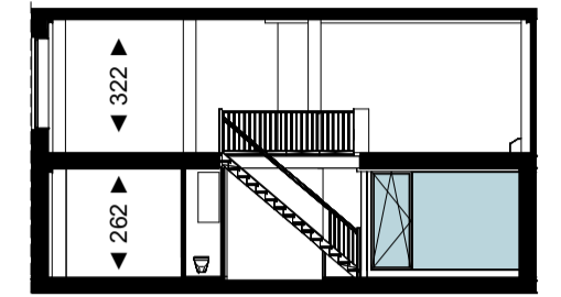
Doorsnede 1 : 200